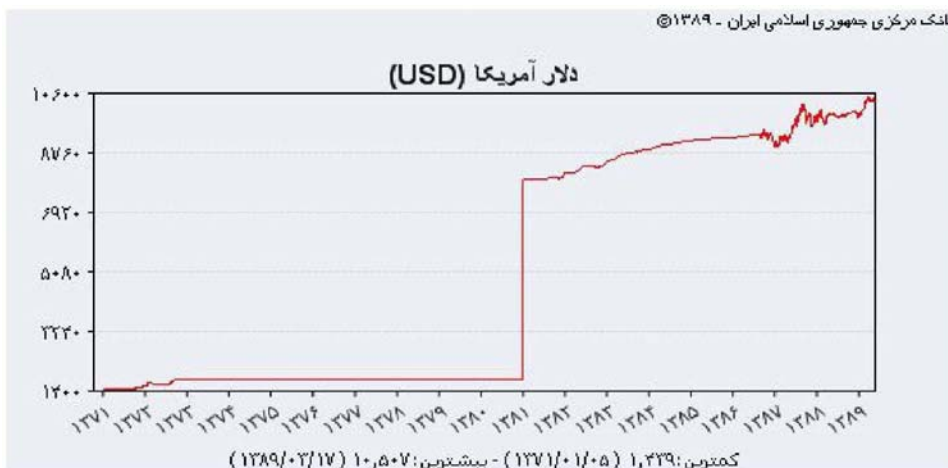
شکل ۱: نمودار نرخ ریال ایران در برابر هر دلار آمریکا

نمی‌باشد، که شکل ۲ نمودار درصد تغییرات لگاریتم نرخ ریال ایران در برابر هر دلار آمریکا گویای این واقعیت می‌باشد. بنابراین در نظر گرفتن دو رژیم منطقی‌تر به نظر می‌رسد. ابتدا مدل اتورگرسیو خطی را به داده‌ها برازش داده، سپس مدل‌های SETAR و MSAR برازش داده می‌شود.